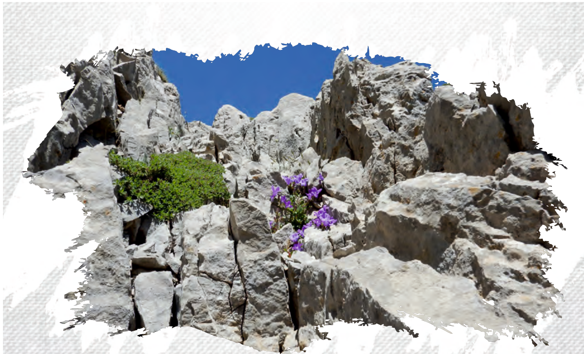
Campanula rupicola Αρχείο ΦΔΕΔΠ/ΡΝΡΜΒ Archive