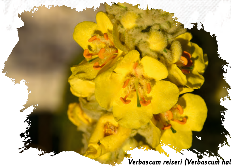
Verbascum reiseri (Verbascum halacsyanum)