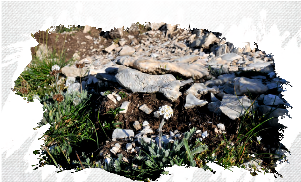
Achillea barbeyana Γιάννης Κοφινάς/Yannis Kofinas