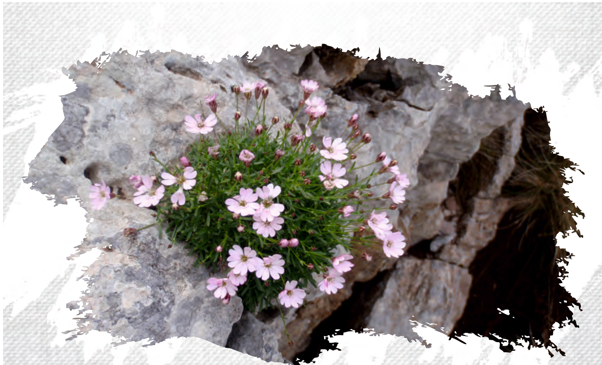
Silene barbeyana Γιάννης Κορινός/Yannis Kofinas