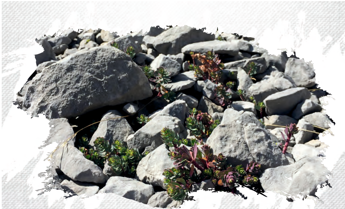
Euphorbia orphanidis Božo Frajman