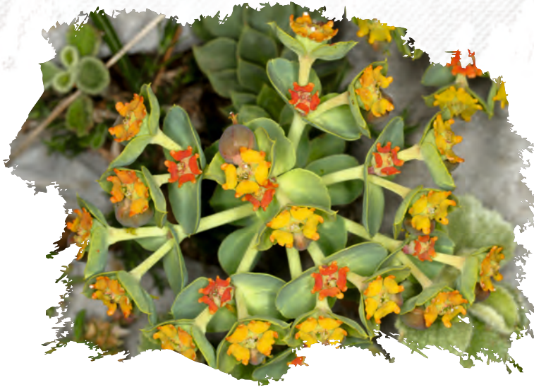
Euphorbia orphanidis Božo Frajman

Το είδος Euphorbia orphanidis είναι ένα σπάνιο ενδημικό του Παρνασσού και φύεται γύρω από τις ψηλότερες κορυφές του βουνού, σε ασβεστολιθικά υπόβαθρα, κυρίως σε σάρες. Ανθίζει Ιούνιο με Ιούλιο.