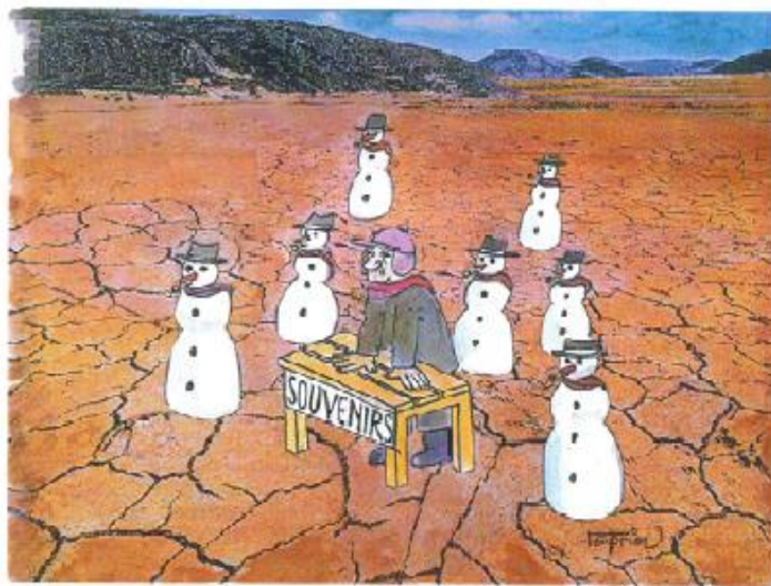
Σχήμα 1. Οι επιπτώσεις της κλιματικής αλλαγής

Η βιοποικιλότητα του πλανήτη Γη, περιβαλλοντικό και οικονομικό απόθεμα, απειλείται από την απληστία και αδιαφορία του σύγχρονου ανθρώπου. Σημαντικότεροι υποβαθμιστικοί παράγοντες του φυσικού περιβάλλοντος σε παγκόσμιο επίπεδο είναι η ρύπανση της ατμόσφαιρας και των υπόγειων υδροφορέων, η αποψίλωση τεράστιων δασικών εκτάσεων, η συνεχώς εκτεινόμενη αστικοποίηση – δόμηση, η κατασκευή ηλεκτροπαραγωγικών μονάδων συμβατικών και πυρηνικών, η λειτουργία λατομικών και μεταλλευτικών επιχειρήσεων, η εκτροπή ποταμών, η παραγωγή λυμάτων καθώς και η επερχόμενη κλιματική αλλαγή. Η αύξηση της θερμοκρασίας μέσα στα επόμενα 100 χρόνια, θα μετατοπίσει τις κλιματικές ζώνες προς τους πόλους και προς μεγαλύτερα υψόμετρα, για τα μέσα γεωγραφικά πλάτη. Καθώς το κάθε είδος πρέπει σε μικρό σχετικά χρονικό διάστημα να ανταποκριθεί στις νέες συνθήκες, η γεωγραφική εξάπλωση και σύνθεση των οικοσυστημάτων θα αλλάξει και τα είδη που δε θα μπορέσουν να προσαρμοστούν αρκετά γρήγορα, θα κινδυνέψουν με εξαφάνιση (Σχ. 1).