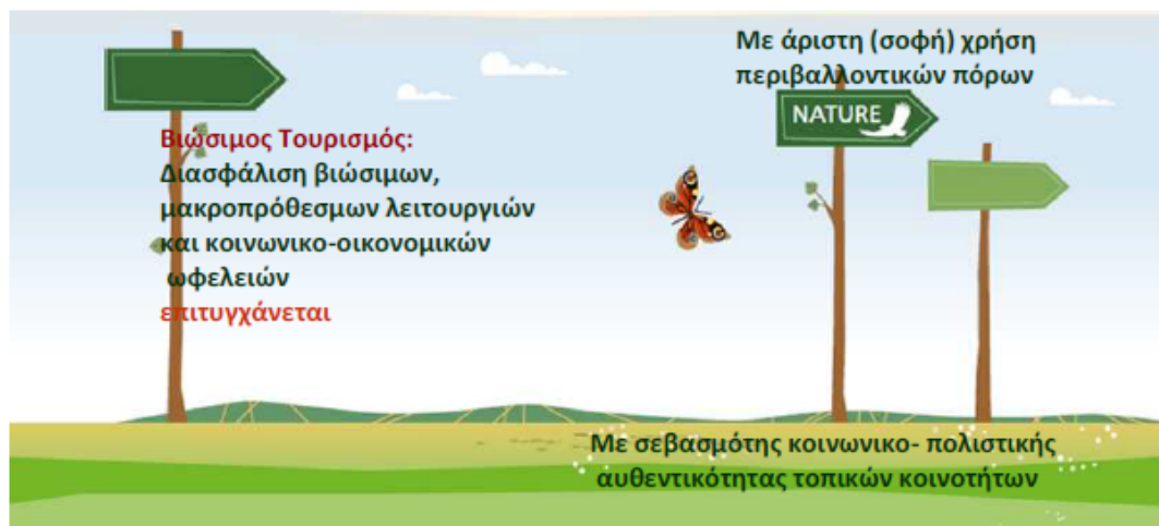
Σχήμα 3. Βιώσιμος τουρισμός

Η ανάπτυξη τουριστικών δραστηριοτήτων σε Προστατευόμενες Περιοχές στηρίζεται στην υπόθεση ότι η επίτευξη κέρδους δεν είναι ασύμβατη με τη διαχείριση, αρκεί να τηρούνται οι όροι προστασίας.