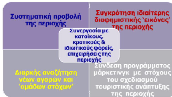
Σχήμα 2. Διαχείριση προγράμματος αιεφόρου ανάπτυξης (Πηγή: Δημιουργία Τοπικού Συμπλέγματος Βιώσιμου Τουρισμού, 2012)

Οι Προστατευόμενες Περιοχές θεωρούνται κατάλληλες περιοχές για την ανάπτυξη υποδομών εκπαίδευσης, βιολογικής γεωργίας και κτηνοτροφίας, αναψυχής και κυρίως οικοτουρισμού. Με δεδομένο πως τα προϊόντα που σχετίζονται με την προστασία της φύσης απευθύνονται σε μια διαρκώς αναπτυσσόμενη αγορά, οι ήπιες και περιβαλλοντικά φιλικές μορφές ανάπτυξης μπορούν να δώσουν τη δυνατότητα ανάπτυξης της περιφέρειας.