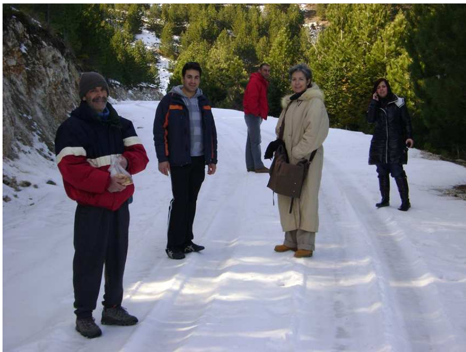
Φωτό 2: Από την εκπαίδευση των Φυλάκων σε θέματα περιβάλλοντος