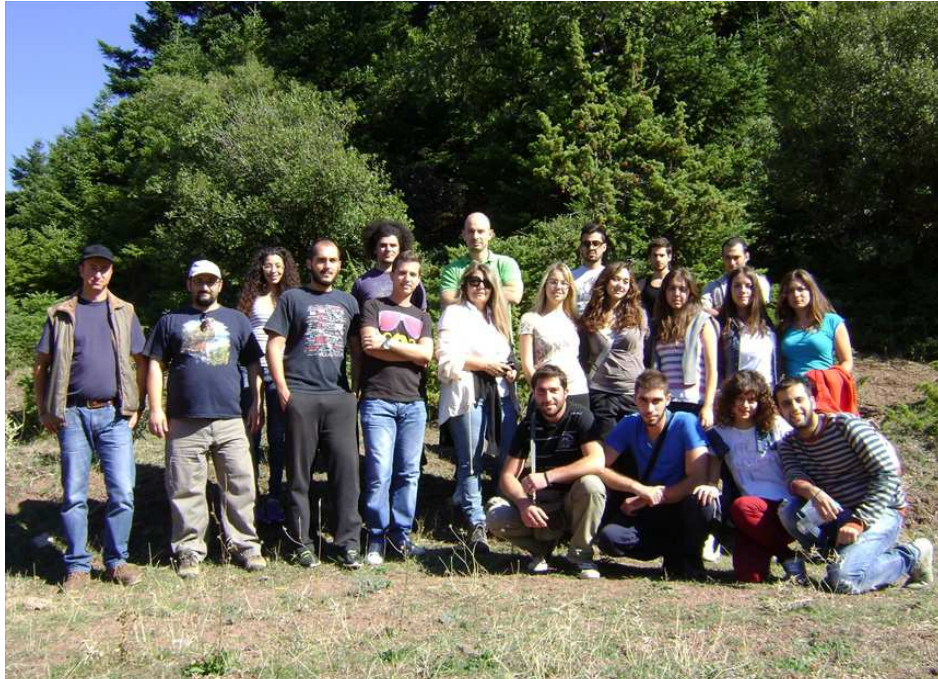
Φωτό 1: Από την ενημέρωση των φοιτητών Δασολογίας του ΑΠΘ

- Εκπαιδευτικό σεμινάριο για θέματα πυρόσβεσης και εκμάθησης συντεταγμένων επί χάρτου από το Πυροσβεστικό Σώμα Άμφισσας, με εισηγητή τον κ. Πολίτη Ιωάννη. Το σεμινάριο παρακολούθησαν οι Φύλακες του ΦΔΕΔ Παρνασσού